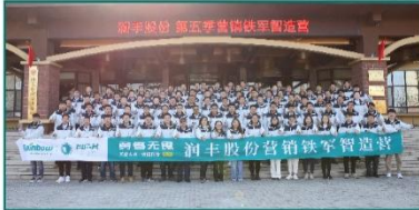
公司第五届营销铁军智造营顺利闭营