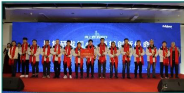
公司举行项目总结表彰大会