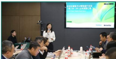
公司SAP系统全球上线