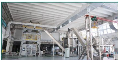
全球日产能最大草甘膦颗粒剂自动生产线投产