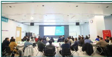
公司启动领导力诊断项目