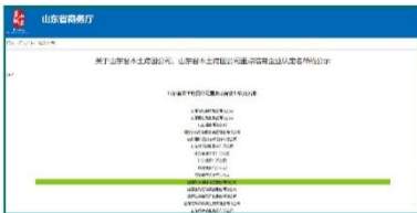
公司被认定为山东省本土跨国公司重点培育企业