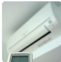
高档电器、器具外壳