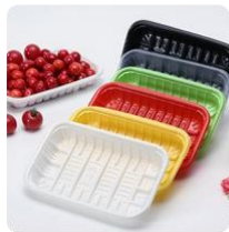
挤出板材（食品接触用产品）

公司生产的主要产品HIPS具有优越的抗冲性及韧性，产品档次较高，是高附加值的环保型新材料，属于国家战略性新兴产业重点产品，具有较高的市场知名度和市场认可度，也是公司的主要利润来源。HIPS广泛的应用场景如下图所示：