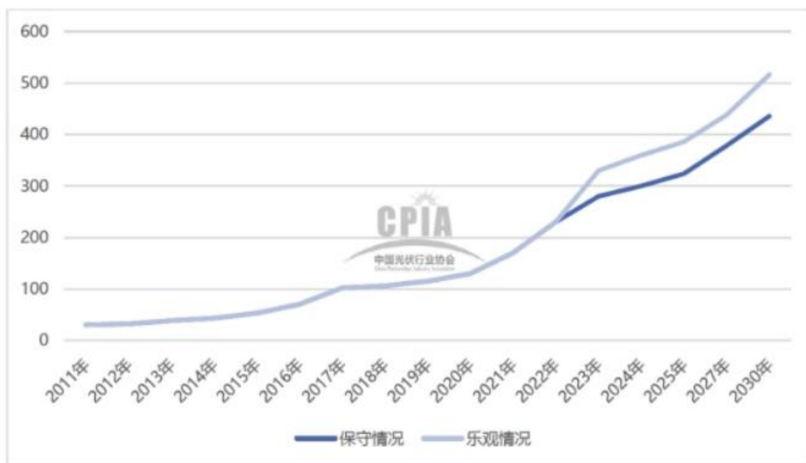
2011-2022 年全球光伏年度新增装机规模以及 2023-2030 年新增规模预测 (单位: GW)

总体来看，国内外“零碳”愿景和可再生能源政策目标不断提高，通过自上而下驱动光伏产业下游装机的增长，从而提高了光伏行业远期发展空间的确信性和成长性。随着全球“碳中和”进程的推进，光伏行业未来发展空间广阔。