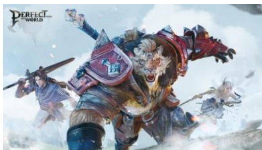
Perfect New World