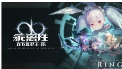
乖离性百万亚瑟王：环