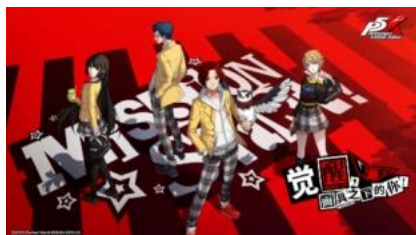
女神异闻录：夜幕魅影