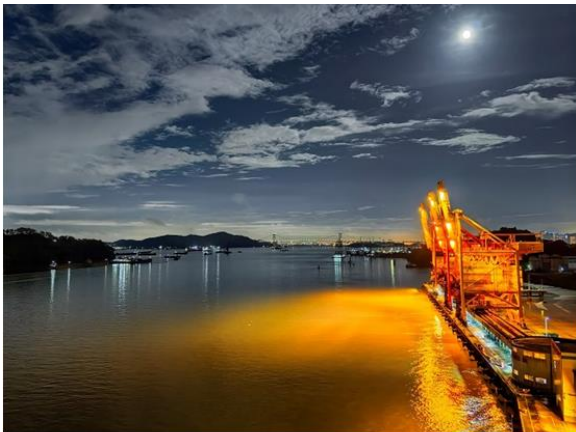
图 2：能源物流集团发展港口公司