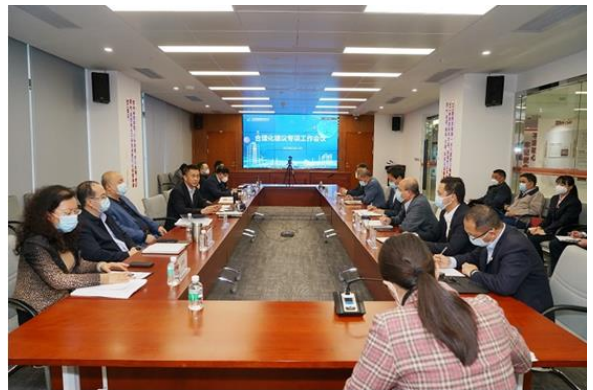
图 11：合理化建议专项工作会议

守稳把牢安全风险。 强化风险防控，实现安全风险分级管控和源头治理；强化外包工程、外围业务、外来人员管理，有效保障重点项目施工安全。截至 6 月 30 日，未发生一般及以上生产安全事故，