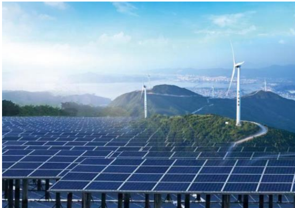
图 4：新能源公司风电、光伏场站图