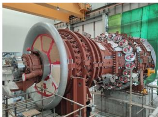
图 7：珠江 LNG 电厂二期项目 2 号燃机复装完成

优拓布局稳中向好。 新增河北天润 150MW 风电项目，实现云浮罗定、开平赤水、亿纬锂电等光伏项目并网发电；山东、山西、宁夏等地风电项目积极推进，广西上思、乐昌云岩等自建项目加快建设。积极推进珠江 LNG 电厂三期、粤西（茂名）LNG 接收站项目前期工作，投资红海湾电厂二期项目扩建，助力大湾区构建清洁低碳、安全高效的能源保障体系。