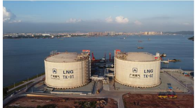
图 3：广州 LNG 应急调峰气源站

把握市场机遇，发挥长协优势，开展国际贸易业务，实现利润同比倍增。做强做优天然气贸易，上半年累计销售气量超过 6 亿立方米，同比增幅超 3 倍。多渠道组织气源，灵活调整气源资源池结构。挖掘广州周边城区潜在用气需求，整合串联上下游资源，实现与周边燃气企业互联互通，打造区域外销售新模式。报告期内管道燃气及 LNG 销售量 14.7 亿立方米，同比增长 59.87%。