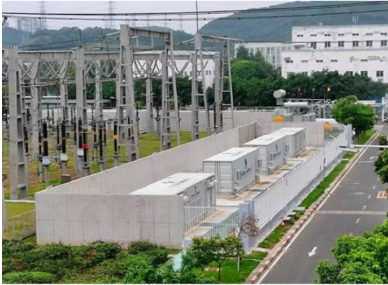
图 10：珠江电厂储能电站

谋篇布局拓展新业务。 借力资本市场，创新发展模式，低碳产业基金全面运作，第一批投资项目初步确立；前瞻布局战略新兴产业，迅速抢占新型储能产业制高点，组建广州储能集团有限公司；设立投资发展部，投资并购功能进一步强化。公司持续推进电力科技公司市场化改革。能源物流集团积极探索开展海关查验、货物集拼等危化品仓储服务，实现危化品仓储租赁量 7 万平方米，同比增长 41%。推进施工商业用户智能表改造，物联网智能燃气