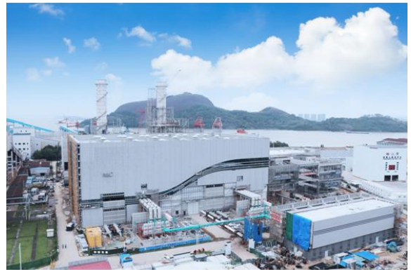
图 1：珠江 LNG 电厂二期

充分发挥发售电一体化优势，优化电煤采购策略，深化精准配煤掺烧，发电效益持续改善，整体盈利能力大幅提升。燃煤电厂与珠电燃料公司协同努力，提高长协煤兑现率，加大掺烧经济煤种力度，标煤单价同比下降；年度电力长协签约价格及签约率均高于全省平均水平，月度中长期和现货交易策略不断优化，售电量足价优。报告期内合并口径火力发电企业完成发电量 83.61 亿千瓦时，上网电量