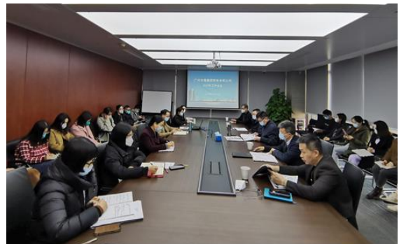
图 5：财务公司提高发展质量工作会议

融资租赁公司围绕能源主业和转型升级战略方向，配合新能源高质量发展开展业务。加强与市属国企间业务协同，把握优质项目机遇，稳妥开拓外部业务。