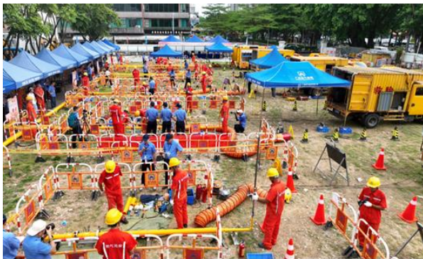
图 12：应急抢险抢修技能竞赛现场

实现连续安全生产 5,488 天。 防范化解经营风险。 全面深化合规管理体系建设，加强重大决策、重要事项审核。