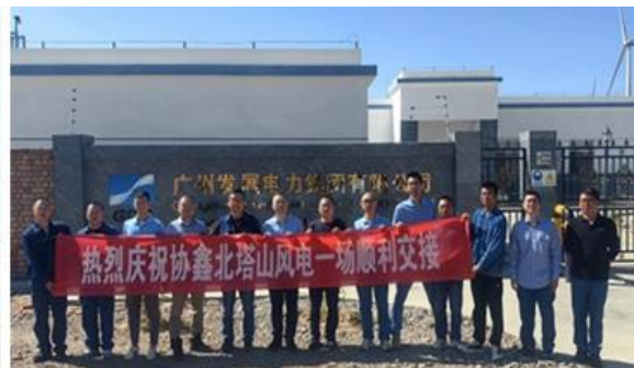
图 9：奇台协鑫项目北塔山风电一场顺利交接