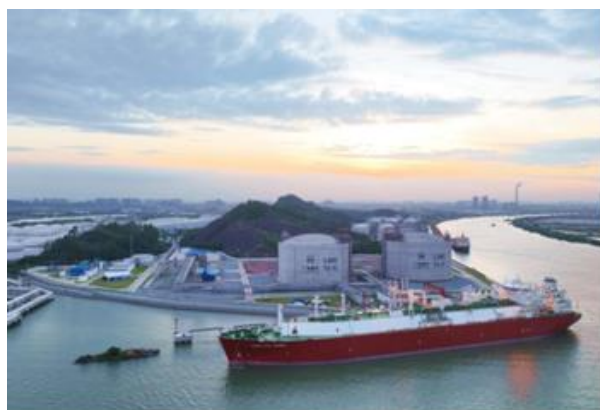
图 6：广州 LNG 应急调峰气源站首船 LNG 到港接卸

重点项目稳中有进。 上半年 14 个市重点项目投资 17 亿元。珠江 LNG 电厂二期项目 1 号机组成功点火并完成蒸汽吹管等里程碑节点；明珠能源站项目完成燃气锅炉调试并具备供热条件；广州 LNG 应急调峰气源站储气库项目基本完工，配套码头工程于 8 月进入试产阶段，配套管线工程加快建设并实现调试段供气；广州市天然气利用四期工程实现中新知识城能源站配套管线全线贯通；广州开发区东区恒运燃气管线工程通气投产；明珠能源站配套管线工程基本完工；金融城综合能源项目取得供冷管网工程规划许可证；旺隆气电替代工程初步具备开工条件；珠江电厂等容量替代项目推进核准申请。