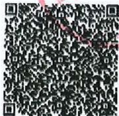
上传兵的年检二维码