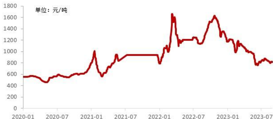
2020 年至今秦皇岛港 5500 混煤平仓价格

有望在下半年得到改善，同时伴随出货量的增加，上市公司有望重新提升盈利能力。具体煤炭价格走势如下所示：