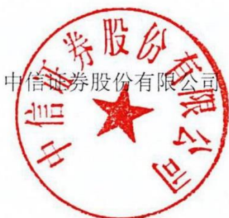
中信证券股份有限公司