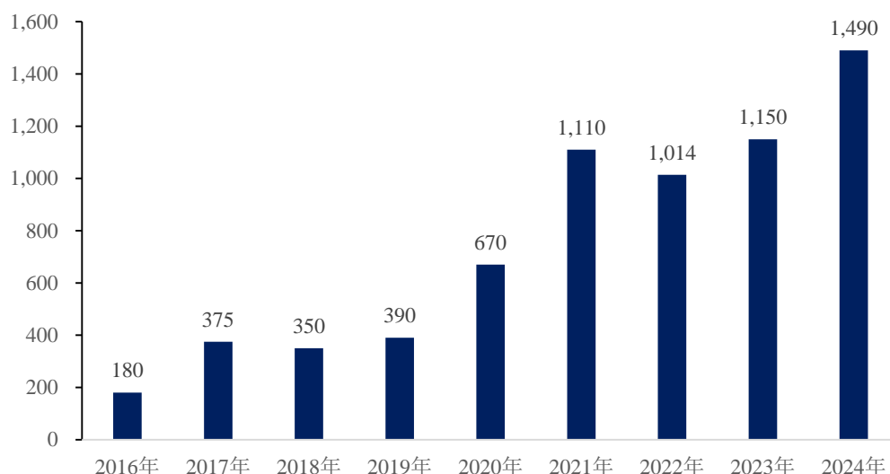
图：2016年-2024年全球VR头显出货量（单位：万台）

VR/AR设备领域方面，随着显示技术、人工智能、感知交互相关技术及显示技术的不断成熟，VR/AR设备给消费者带来沉浸式及交互式体验感持续提升，VR/AR设备出货量迅速增长。2020年，随着Facebook发布Meta Quest2一体机，VR产业的大众化时代随之开启。根据wellseenn XR的统计数据，2019年，全球VR头显出货量为343万台，而到了2021年，全球VR头显出货量已经达到了1,029万台。根据 VR 陀螺发布的《2022年全球VR/AR年度产业发展报告》，2021年全球VR头显出货量约1,110万台，VR头显全球出货量自2020年开始进入高速增长轨道，2022年VR终端出货量为1014万台，较2021年下滑了8.65%，这主要系部分产品提价导致的销量放缓所致，预计2023年全球VR出货量将达到1,150万台，同比增长13.4%，到2024年全球VR出货量将达到接近1,500万台。