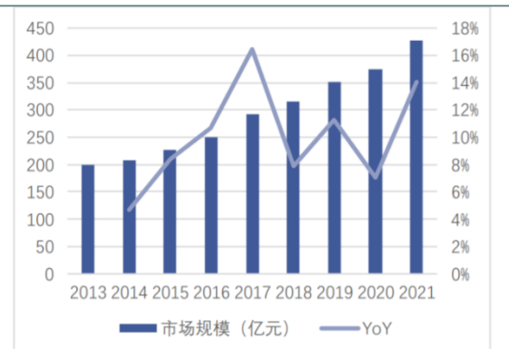
图表 43：2013-2021 年中国变频器市场规模