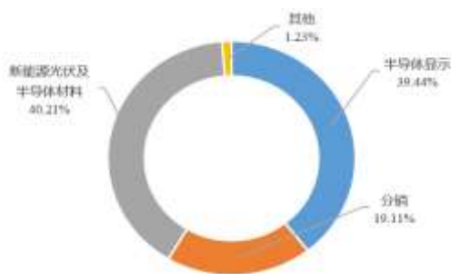
图 1：2022 年收入构成情况

公司前身 TCL 集团有限公司，成立于 1981 年，后经股改并于 2004 年在深圳证券交易所挂牌上市(000100.SZ)。2019 年 4 月，公司进行重大资产重组，剥离终端及配套业务；2020 年 2 月公司更为现名；2020 年第四季度公司股权收购天津中环电子信息集团有限公司 1 ；2021 年 5 月公司向关联方 TCL 实业控股股份有限公司出售 TCL 金服控股（广州）集团有限公司 100% 股权，至此，公司形成以半导体显示、新能源光伏及半导体材料业务为核心主业的业务架构。2022 年公司实现营业收入总收入 1,666.32 亿元。