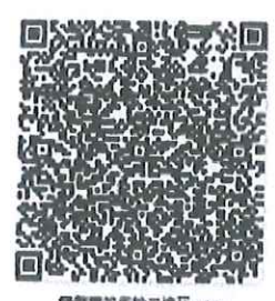
白慧莹的年检二维码.png

本证书经检验合格，继续有效一年。 This certificate is valid for another year after this renewal.