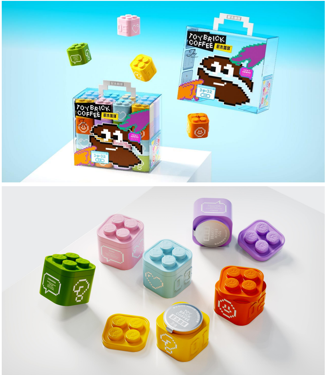
图二 食品类作品《积木咖啡包装》