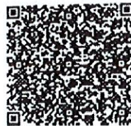
徐立群年检二维码

本证书经检验合格, 继续有效一年。 This certificate is valid for another year after this renewal.