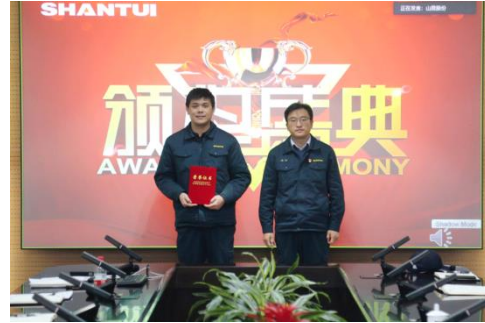
年度安全生产工作会议

公司创新建立分类分级监管机制，对涉及重大隐患风险的单位作为 I 类单位，关注重大隐患风险管控，其他作为 II 类单位，关注整体风险管控稳定；根据安全生产状况和管理绩效进行分级，从高到低判定为“A.B.C.D”四个等级。按照 I 类单位严于 II 类单位，低等级单位严于高等级单位的标准，差异化实施生产安全管理。