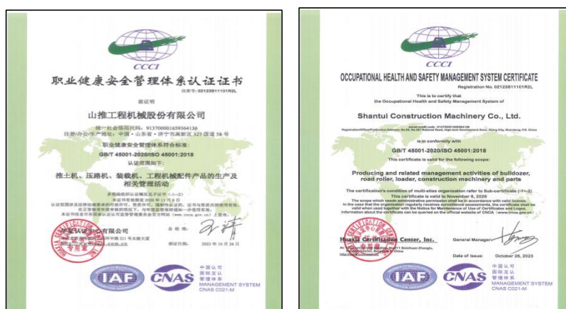
ISO45001 职业健康安全管理体系认证证书

推进重要时间阶段、重点区域、重点人群、重大事故隐患风险管控，组织开展“紧绷安全弦 保障一季度”“全国两会”“强化叉车安全管理”“防雷设施分类分级管控”“重大事故隐患专项治理”“悬臂吊专项治理”“机械伤害、物体打击事故和有限空间作业专项整治”等专项活动17项，加大现场隐患查处频次、强度，推进事故易发关键环节、要害岗位、重点设施的重大隐患“清零”，控制重点领域隐患。