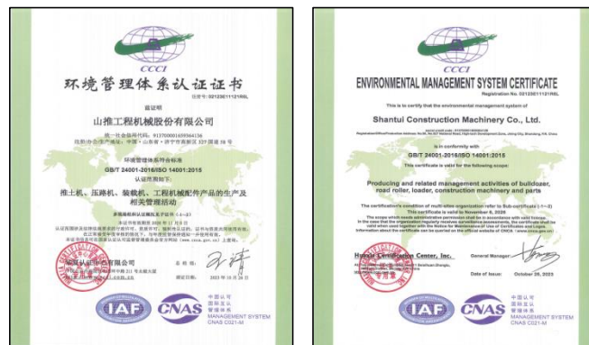
ISO14001 环境管理体系认证证书

公司 ISO14001 环境管理体系一直保持有效运行和持续改进，2023 年通过体系再认证审核，围绕“遵法守纪、明确责任、预防为主、全员参与、持续改善”，建立长效改进机制，持续提高环境绩效。