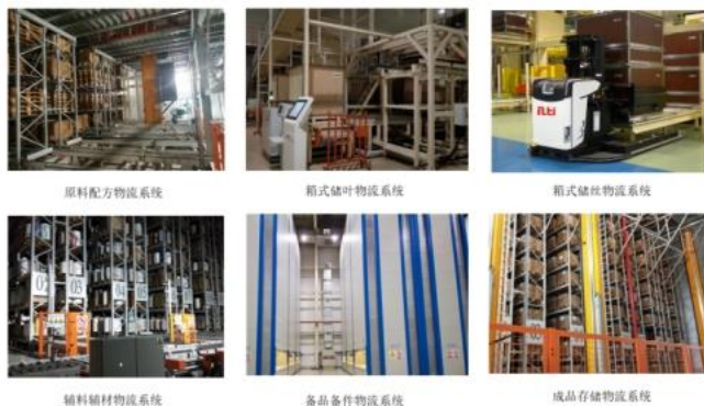
公司智慧物流和智能制造系统在烟草行业应用的实景图