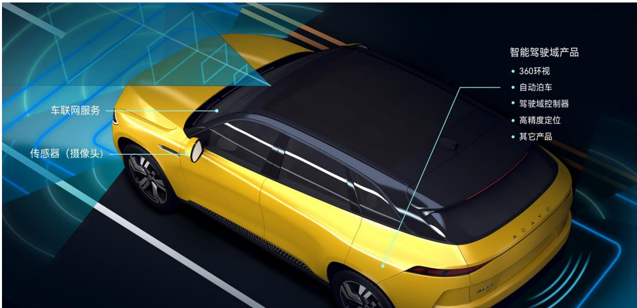
公司汽车电子业务智能驾驶及网联产品应用场景示意图

公司顺应汽车 EE 架构变化的趋势，以 SOA 架构为桥梁，通过敏捷开发、配置化管理等实现跨域功能融合和快速稳定交付。公司已推出舱泊一体域控产品，正在研发舱驾一体、中央计算单元等跨域融合产品，持续提升汽车电子系统集成优势。