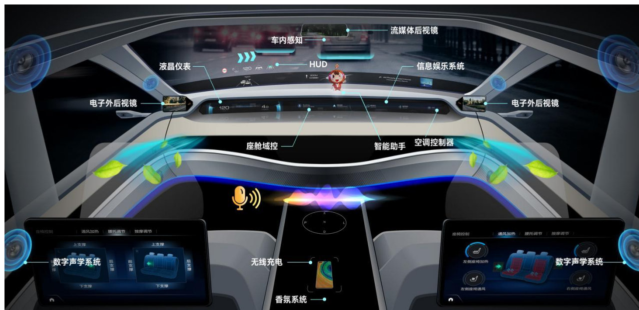
公司汽车电子业务智能座舱产品应用场景示意图

在智能座舱领域，公司坚持以用户体验和使用价值为导向，提供丰富产品的同时，集成软硬件系统和丰富的生态资源，并运用多种创新的人机交互技术，围绕智慧出行、万物互联的应用场景，向客户提供多功能融合的先的智能座舱解决方案，为用户提供沉浸式的智能座舱体验。