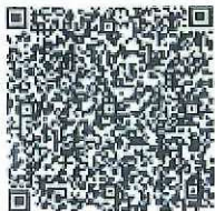
岑敬的年检二维码

本证书经检验合格, 继续有效一年。 This certificate is valid for another year after this renewal.