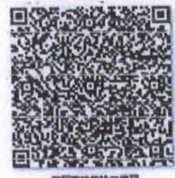
真码查的年检二维码

本证书经检验合格，继续有效一年。 This certificate is valid for another year after