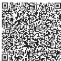
段守凤年检二维码

本证书经检验合格, 继续有效一年。 This certificate is valid for another year after this renewal.