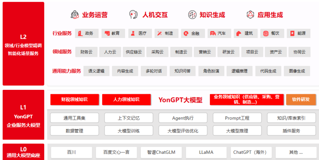
YonGPT 企业服务大模型整体架构图

基于大模型的人工智能在企业服务领域的应用主要集中在 4 个方向上：智能化的业务运营、自然化的人机交互、智慧化的知识生成、语义化的应用生成。用友企业服务大模型 YonGPT 围绕这四个方向推进模型训练和产品效果优化，是更懂企业服务的大模型。YonGPT 已经创新研发了包括企业经营洞察、智能订单生成、供应商风控、动态库存优化、智能人才发现、智能招聘、智能预算分析、智能商旅费控等在内的基于企业服务大模型赋能的智能应用。同时，YonGPT 面向复杂的行业应用场景，还可以通过对行业模型精调，提供更加“在行”的智能化场景服务。