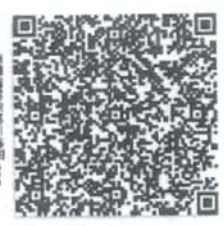
手机扫描二维码二进所.org

本证书经验合格，继续有效一年。 This certificate is valid for another year after this renewal.