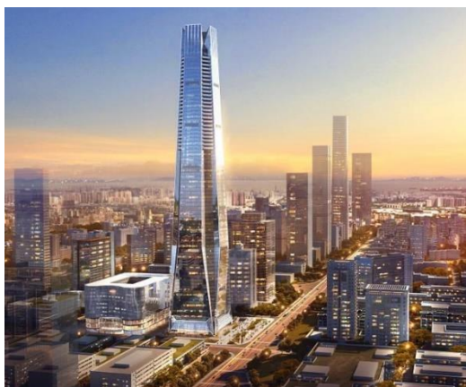
图7：NCC钢结构应用于超高层建筑