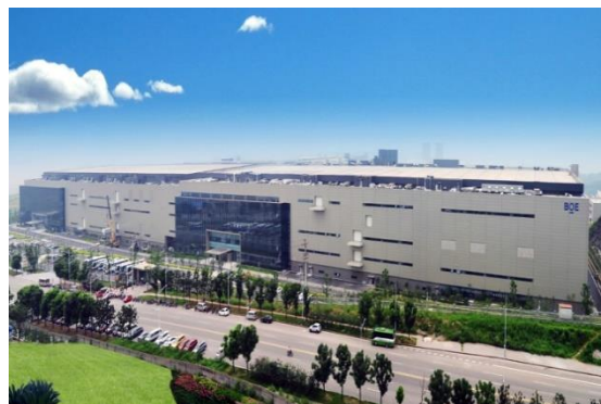
图6：NCC钢结构应用于高端电子厂房