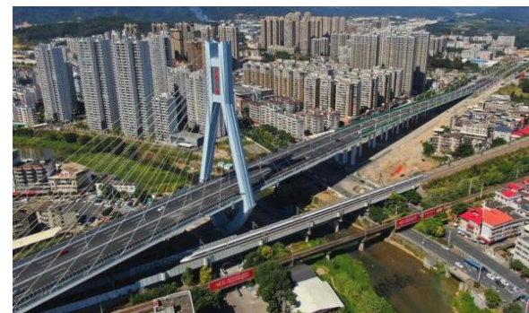
图10：NCC钢结构应用于公路跨线桥