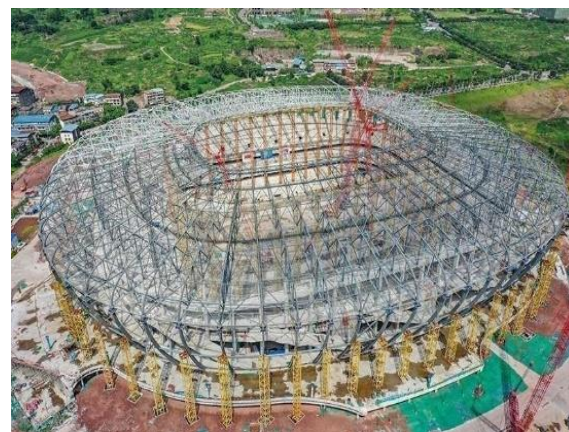
图8：NCC钢结构应用于体育场馆