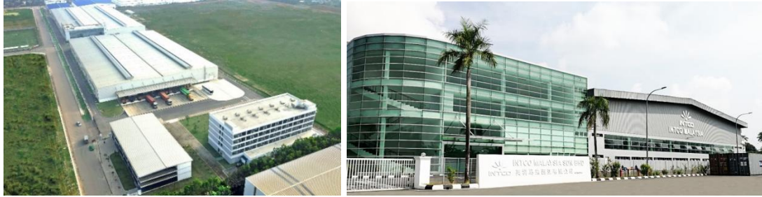
图一公司越南、马来西亚生产基地