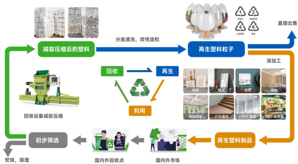
图—公司独具特色的商业模式

在塑料回收领域，公司创新“特殊粉碎”、“提高压缩、输送效率”“成型仓表面冷却结构”等减容装备结构，有效压缩比可高达50倍以上。