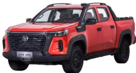
长安开拓者·探索版

长安开拓者·探索版，定位“运动型越野皮卡”。拥有 2.0T 蓝鲸动力，采埃孚 8AT 变速箱，博格华纳四驱系统，五种自由驾驶模式，同时配备了高性能越野运动悬架，全地形锁止系统，18 寸全地形越野胎，最大 800mm 高位涉水喉，14,000 磅电动绞盘，2.5 吨拖拽资质，将为勇于探索、饱含热爱的用户实现所向往的皮卡生活。