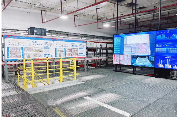
库房内数字化看板