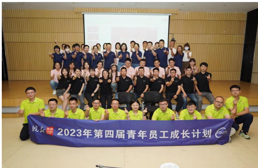
第四届青年员工成长计划