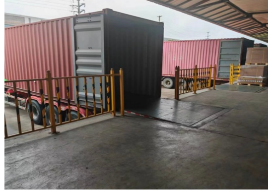
库房内升降平台、月台