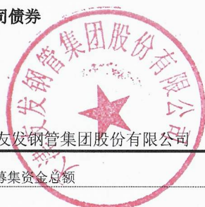
附表 1: 可转换公司债券