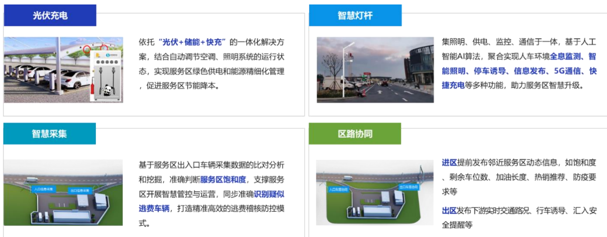
图六：智慧服务区方案

智慧服务区解决方案是以“数据挖掘、智慧服务”为核心理念，通过多源传感、大数据、人工智能、区路协同以及先进能源技术对服务区进行升级改造，集智慧采集、光伏充电、智慧灯杆、区路协同模块于一体，实现服务区流量监测、重点车辆管控、逃费稽核、区路协同，打造智慧赋能、服务优质、绿色低碳的高品质服务区，提高服务区运营管理效率，提高旅客服务体验。