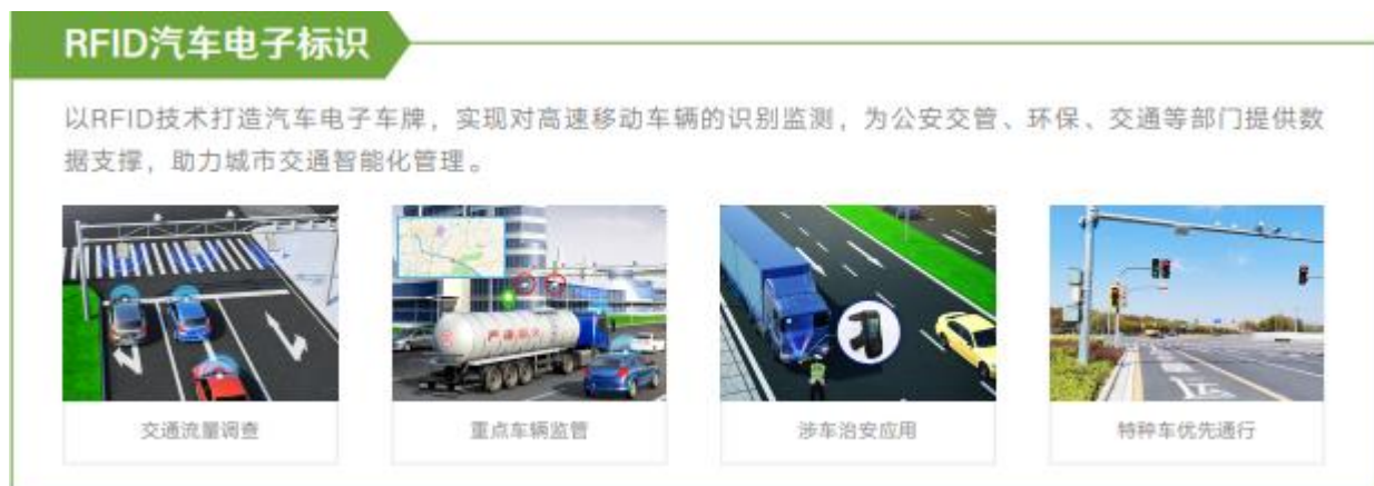
图十：RFID 技术应用方案