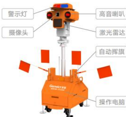
图七：安全管控机器人

智慧养护施工业务通过安全管控机器人对施工现场进行实时监控录像，智能识别并抓拍现场安全隐患，依托多源感知+AI 算法，实现施工现场可视化及全天候云监控，打造现场可视、施工管理全流程数字化、安全监管全方位智能化的高速公路养护施工安全管控网，提升养护施工管控效率。