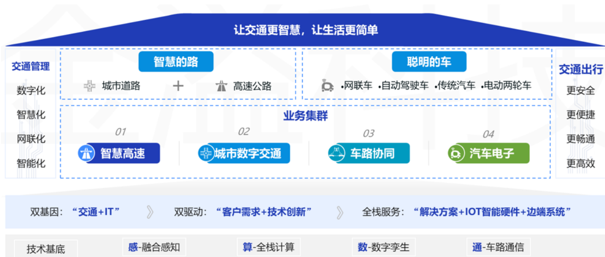
图一：公司业务集群

公司持续聚焦智慧交通领域，秉持“让交通更智慧，让生活更简单”的企业使命，专注于智慧交通领域数字化、网联化、智慧化建设。公司聚焦智慧的路和聪明的车两大核心场景，面向智慧高速、城市数字交通、车路协同、汽车电子业务领域的智慧收费、智慧停车、智慧高速、智慧路口、智能网联、车路协同、自动驾驶等业务场景，提供“解决方案+IOT 智能硬件+边端系统”全栈式服务，赋能交通管理实现智慧升级，服务公众安全、便捷、畅通、高效出行。