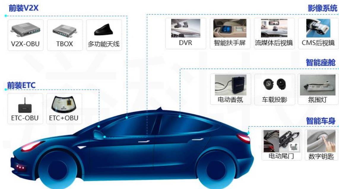
图十三：汽车电子业务及部分产品图示

T-BOX 等智能网联产品；在其他车身电子方面，公司基于相关合作优势以及公司车规级 IT 电子定制开发能力优势，开发了氛围灯、电动尾门、数字钥匙、流媒体后视镜、CMS 电子后视镜、行车记录仪等汽车电子产品。