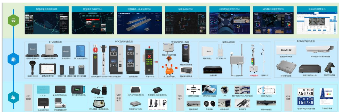
图二：公司产品体系