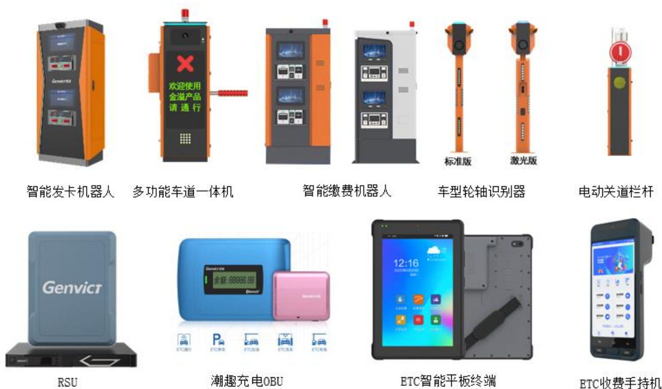
图四：高速收费站智能收费机器人系列产品及 ETC 相关产品

品，并拥有匝道预交易、ETC 自由流收费、ETC 运行监测等技术和解决方案。近年来公司不断优化产品性能，提升收费准确度和通行效率，公司 ETC 产品现已服务全国近三十个省市高速公路收费站。针对传统人工收费场景数字化、智能化、少人化改造需求，公司推出了新型智能收费系统，助力高速收费站向标准化、智能化、自动化方向发展，提高高速公路通行效率，提升高速出行服务水平。在新型智能收费系统解决方案中，公司研发生产的 AI 智能车型识别器、智能收费机器人可分别实现车型及车牌 AI 智能识别、收费站全自动无人化自助缴费，在高效快捷通行的同时可大幅减少收费站人力成本，提高收费站整体运营管理效率。