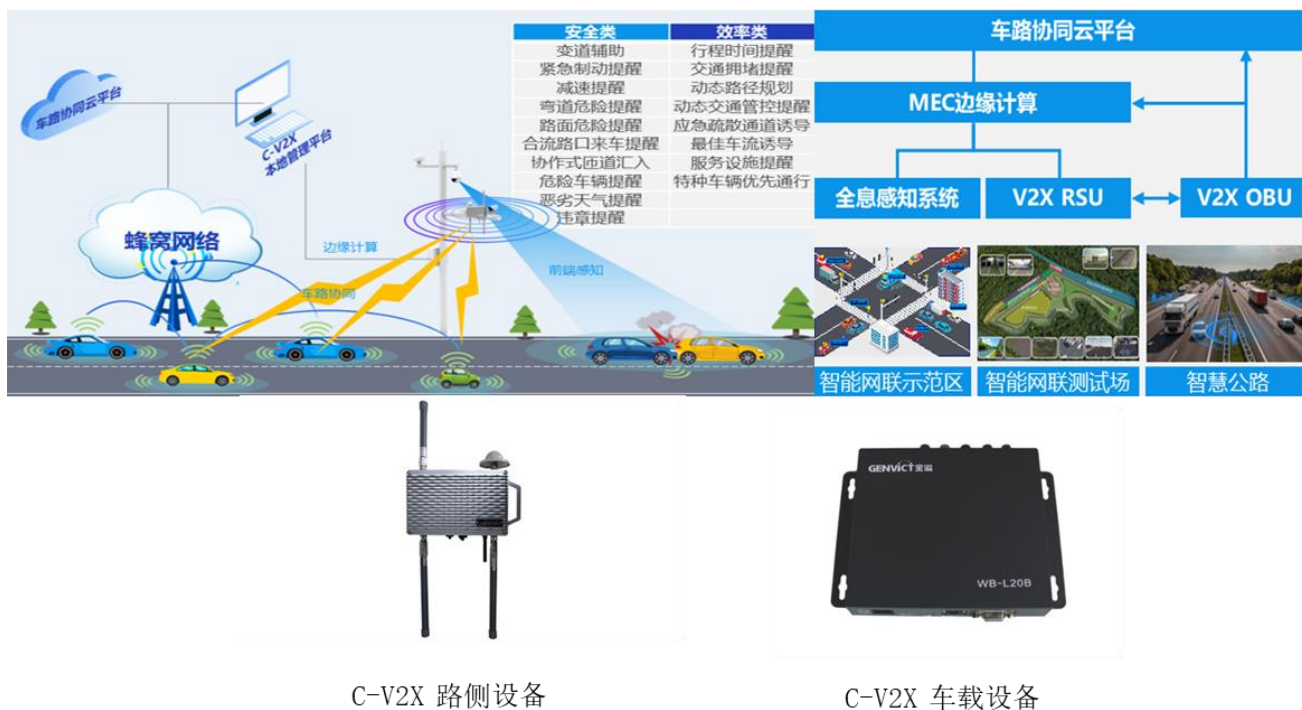
图十一：智能网联车路协同云、端产品