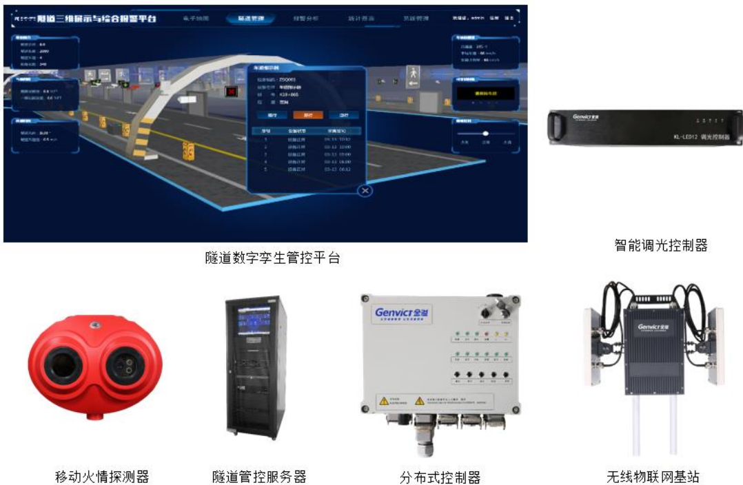
图五：智慧隧道云、端产品