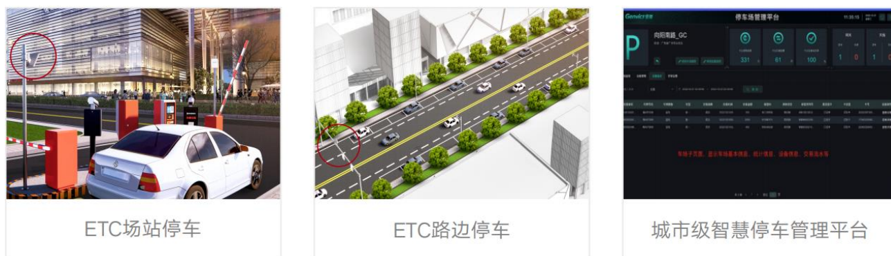
图十二：智慧停车业务

城市级智慧停车解决方案是利用 ETC “识别+支付” 属性，赋能路内外停车实现 ETC 账户全自动扣费，不停车收费，可提高路边停车、场站停车运营收益，提升用户停车体验。