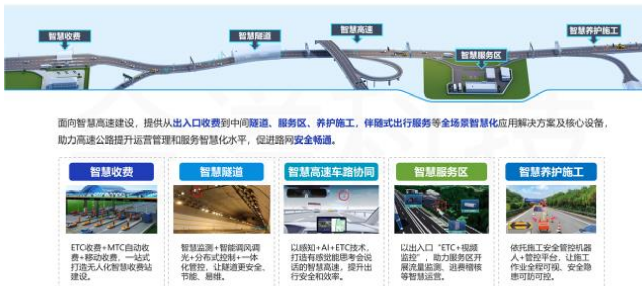
图三：智慧高速业务图示

智慧高速业务是公司基于智慧收费、智慧隧道、智慧服务区、智慧养护施工等高速公路全场景布局的业务。公司依托 ETC 等智能设备作为数字交通信息入口，结合大数据分析、AI 计算等信息技术，形成了强大的智能交通管理决策分析及智能应用能力，可面向高速公路管理者 and 使用者提供丰富的智能交通管理数字化应用方案与服务。公司针对全场景提供边、端、云协同方案，为行业打造有感觉、能思考、会说话的智慧高速，助力高速公路提升运营管理和水平，促进路网安全畅通，服务公众便捷高效出行。