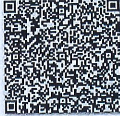
夏焯的年检二维码

本证书经检验合格, 继续有效一年。 This certificate is valid for another year after this renewal.