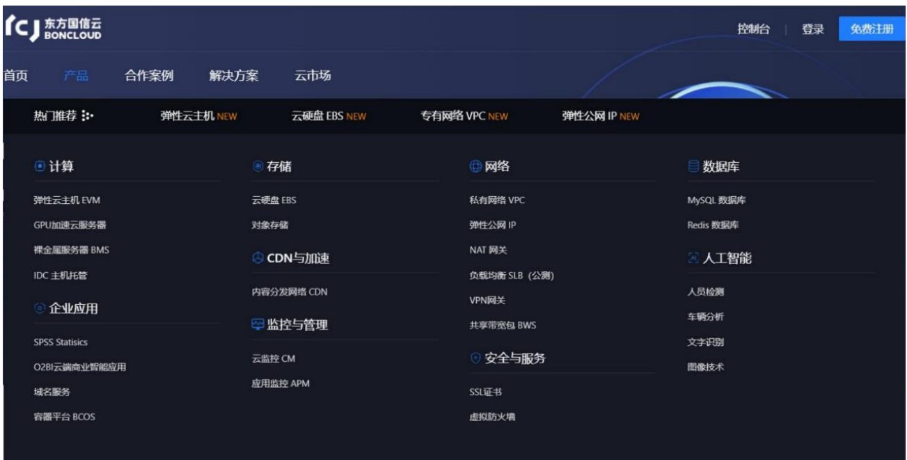
东方国信云产品矩阵

东方国信云计算业务BONCLOUD是依托东方国信多年的云计算技术研发和服务积累，结合优质数据中心资源，打造的云服务平台。公司结合20多年企业级IT及大数据服务经验，在工业互联网、政务、金融等企业级市场全面布局，可提供从服务器机柜租赁、裸金属到私有云、公有云、混合云等一体化、自动化、智能化的端到端交付解决方案。云业务实现全局的安全监测和预警，风险实时发现和威胁精确定位，保障系统和数据安全,专业服务上千内外部客户。