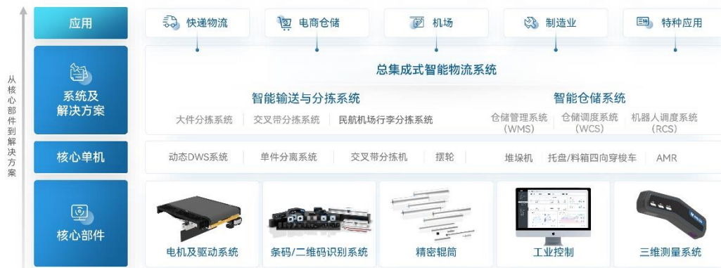
图：中科微至产品矩阵示意图

公司自主研发图像型条码识别技术、视觉位置检测技术、分拣控制系统软件等核心技术，是国内同行业中少数能提供从核心软硬件到系统集成的智能物流输送分拣装备全产业链科技创新企业之一。