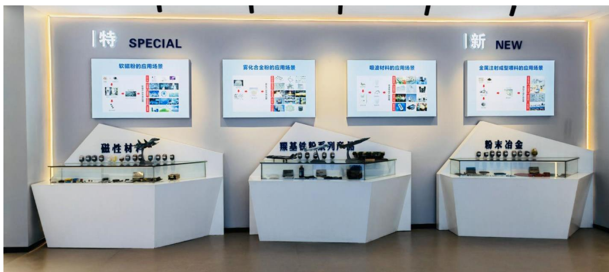
图 4：公司展厅-“专精特新”区域

为满足公司长期战略发展需要，帮助公司吸引和聚集更多中高层次人才，公司在赣州市布局建立新研发中心，并采取了制定人才成长、培养路径与定向培养等多种举措，通过改善办公条件、优化公司文化等方式，力争为公司培育出具备强大创新能力的战略后备人才。公司未来还将根据具体情况对优秀人才持续实施股权或期权激励计划，将公司利益、个人利益与股东利益相结合，有效地激励优秀人才。