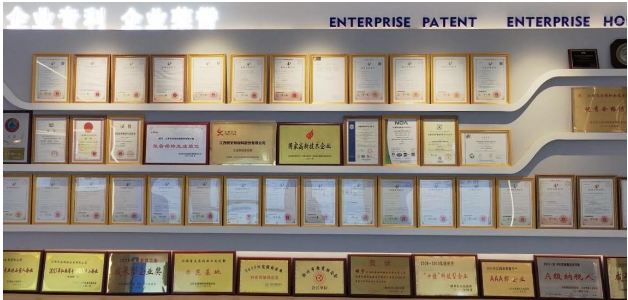
图 5：企业专利及荣誉