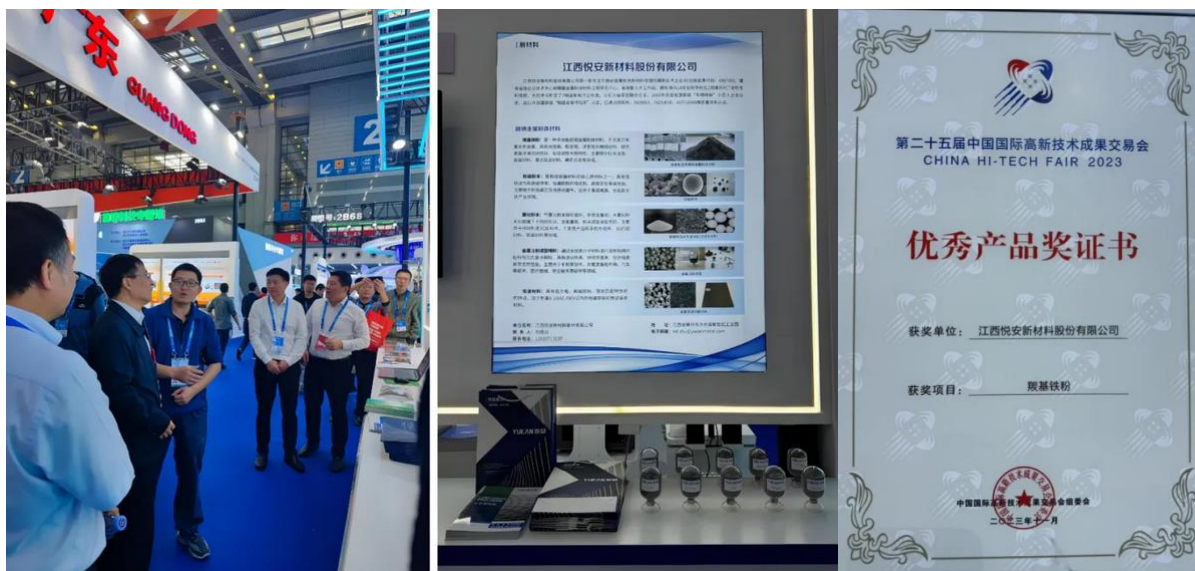
图 2：公司参加 2023 年第二十五届高交会，期间公司羰基铁粉荣获“优秀产品奖”

2023 年，公司受邀参加了第二十五届中国国际高新技术成果交易会（以下简称“高交会”），在该次盛会中，公司的羰基铁粉系列产品从众多参展展品中脱颖而出，荣获由高交会组委会颁发的“优秀产品奖”。该奖项是对公司在高新技术领域所取得的卓越成就的肯定，也标志着公司的产品技术和市场竞争力获得了业界的高度认可。同年，江西省商务厅为推动本地出口品牌建设并加快培养新的外贸竞争优势，开展了“江西出口名牌”企业的年度认定工作。经过一系列严格的审核与评估流程，认定公司为 2023 年度“江西出口名牌”企业。公司坚信，这些荣誉将有助于增强公司的品牌影响力，并为公司的持续成长和市场拓展提供助力。