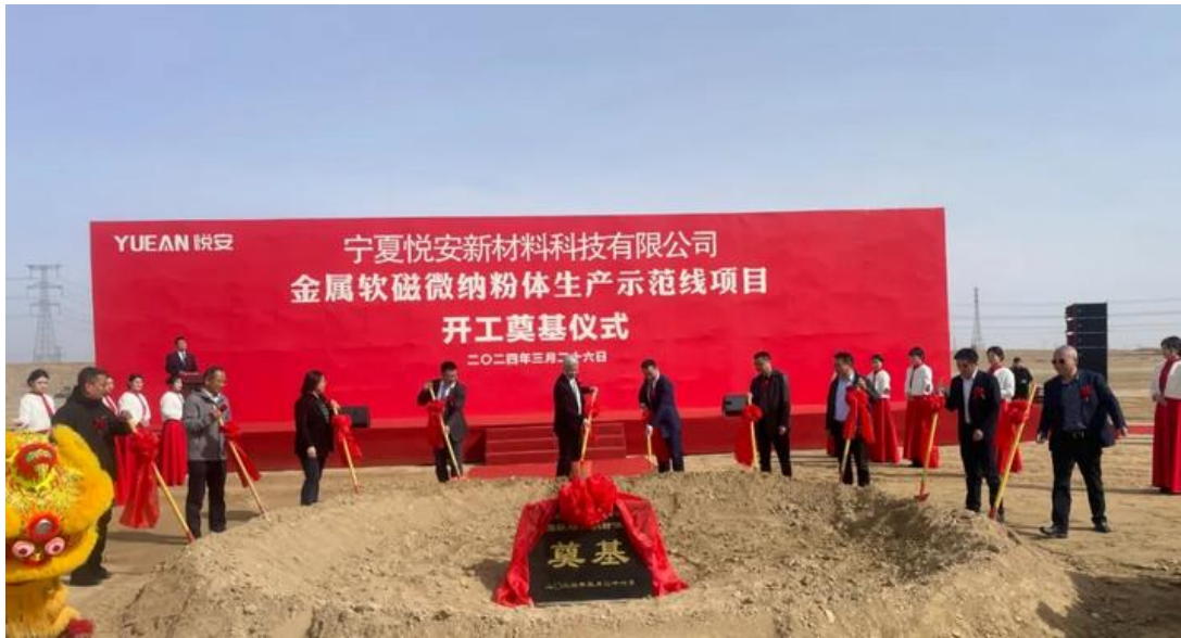
图 3：“年产 10 万吨金属软磁微纳粉体项目”第一期示范线开工奠基仪式

2024 年，公司将持续推进上述项目的运行，积极开拓市场，优化产线运行情况，并从各方面推进降本增效，提升公司羰基铁粉、软磁粉末和雾化合金粉等系列产品的市场占有率，带动公司业务上一个新的台阶。