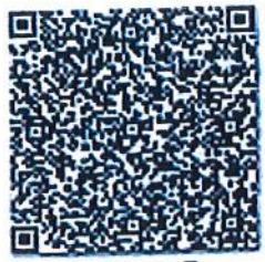
离题的年检二维码

本证书经检验合格, 继续有效。 This certificate is valid for another year after this renewal.