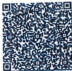
关联的单位二维码

本证书经检验合格, 继续有效。 This certificate is valid for another year after this renewal.