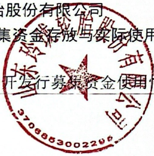
附表2：非公开发行人募集资金使用情况对照表(续)：

2022年4月13日，本公司第四届董事会第三十四次会议审议通过了《关于使用部分闲置募集资金暂时补充流动资金的议案》，独立董事、监事会及保荐机构均就上述事项出具了同意意见，同意本公司使用部分闲置募集资金人民币350,000,000元暂时补充流动资金，使用期限自董事会审议通过之日起不超过十二个月，上述暂时用于补充流动资金的闲置募集资金需于2023年4月12日前归还。2022年7月7日，本公司发布《关于提前归还部分募集资金的公告》，提前归还募集资金人民币100,000,000元；2022年9月14日，本公司发布《关于提前归还部分募集资金的公告》，提前归还募集资金人民币50,000,000元；2022年10月29日，本公司发布《关于提前归还部分募集资金的公告》，提前归还募集资金人民币50,000,000元；2022年12月13日，本公司发布《关于提前归还部分募集资金的公告》，提前归还募集资金人民币50,000,000元；2023年1月17日，本公司发布《关于提前归还部分募集资金的公告》，提前归还募集资金人民币50,000,000元；2023年2月24日，本公司发布《关于提前归还部分募集资金的公告》，提前归还募集资金人民币50,000,000元。截至本报告报出日，上述暂时用于补充流动资金的闲置募集资金已经全额归还至募集资金存放专用账户。