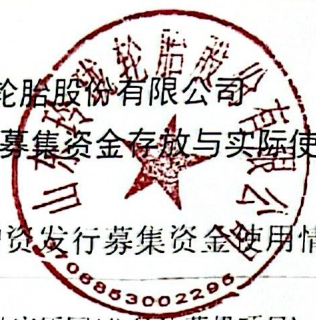
附表 1: 增资发行募集资金使用情况对照表(续):