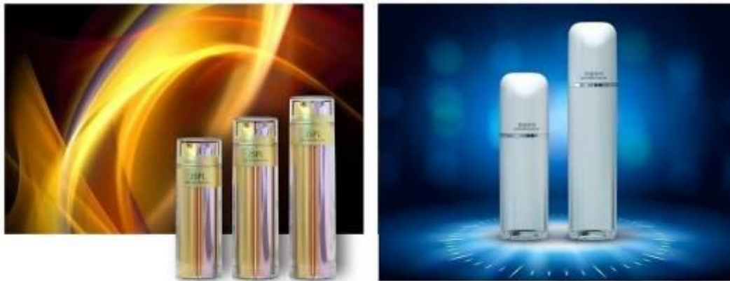
乳液瓶系列产品示意图