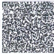
更新的年检二维码.png

本证书经检验合格，继续有效一年。 This certificate is valid for another year after this renewal.