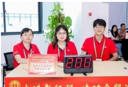
海南药业参加制药行业职工劳动技能大赛