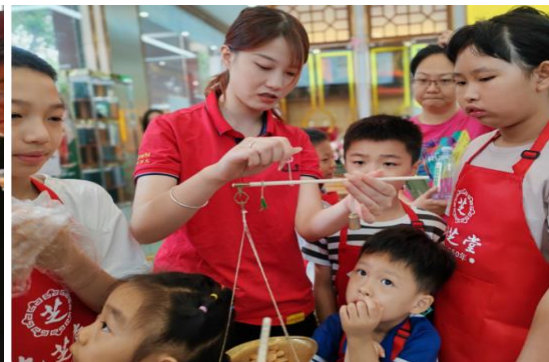
九芝堂开展“传承中医药 小小中药师” 中医药文化亲子研学公益行