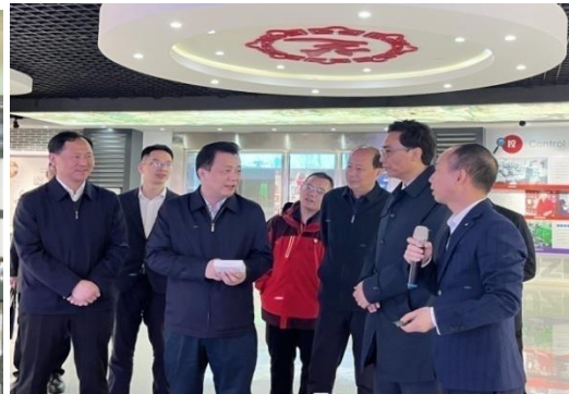
湖南省副省长秦国文调研走访