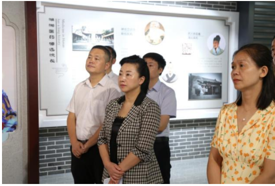
湖南省、长沙市两级人大教科文卫委调研走访