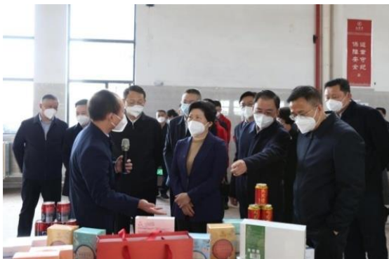
湖南省委常委、长沙市委书记吴桂英调研走访黑龙江省政协主席、党组书记蓝绍敏调研走访