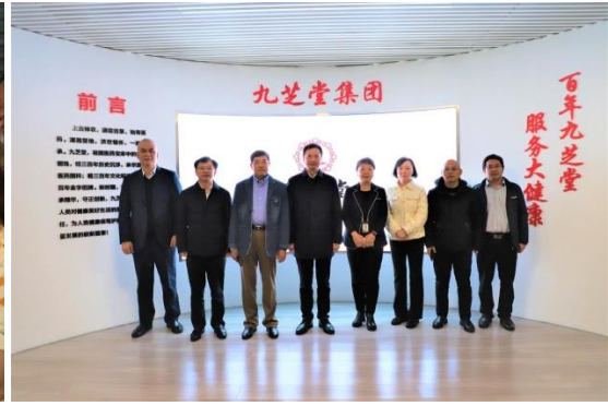
浏阳市人民政府领导调研走访