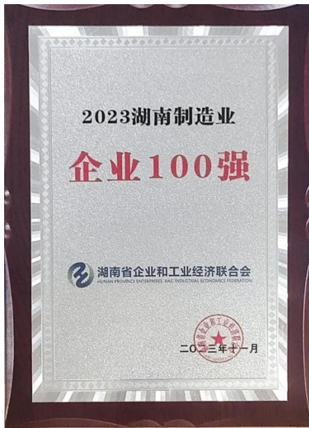
九芝堂荣登湖南省制造业 100 强榜单