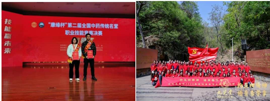
全国中药传统名堂职业技能竞赛中获奖员工 公司五四主题团建活动圆满举行