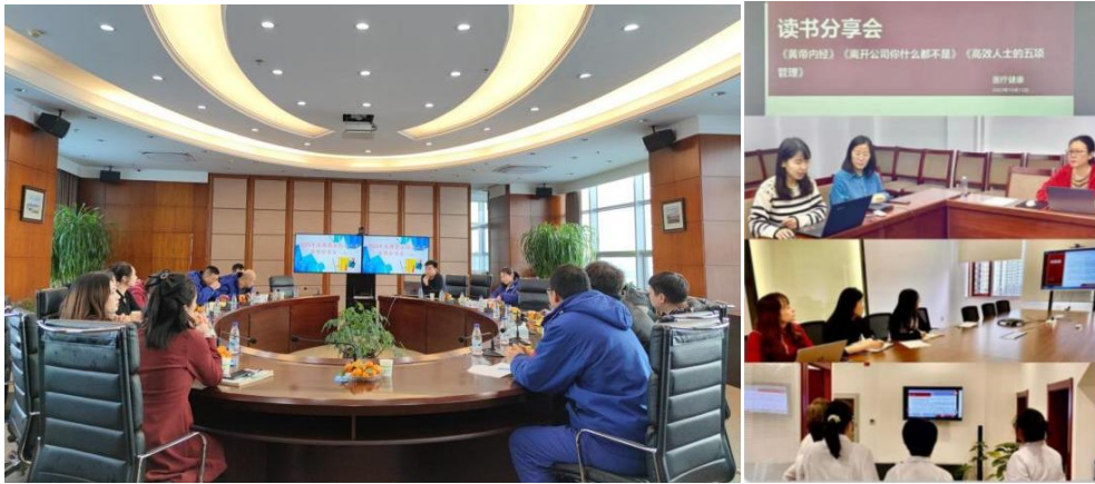
公司开展读书学习活动