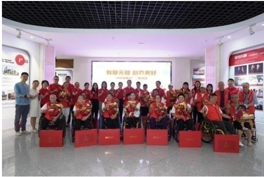
九芝堂牵手美人鱼公益 开展“有爱无碍 创想美好”主题活动