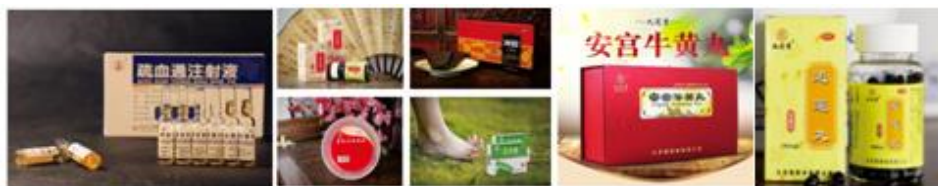
公司七大过亿单品

公司拥有国家药品注册批文 327 个，其中独家品种 35 个，包括 OTC 类、处方药类、大健康类系列产品，品类覆盖心脑血管、补肾、补血、妇儿、五官科等各个领域。公司拥有传统中药类“九芝堂”牌系列产品、现代中药类“友搏”牌系列产品、生物制剂产品“斯奇康”及大健康系列产品。目前，公司已建立起以疏血通注射液、六味地黄丸、逍遥丸、安宫牛黄丸、驴胶补血颗粒、阿胶、足光散、斯奇康、裸花紫珠片等的第一梯队产品，小金丸、补肾固齿丸、归脾丸、补中益气丸、杞菊地黄丸、知柏地黄丸、桂附地黄丸等第二梯队产品，孵化独家、特色的阿珍养血口服液、生发丸、健肺丸、喉炎丸、补肾填精口服液等第三梯队产品。