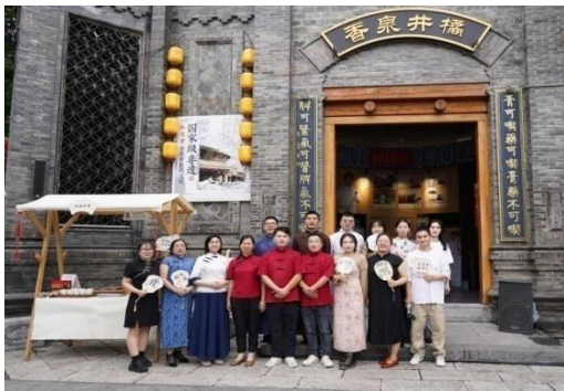
参展湖南省第二届非物质文化遗产博览会