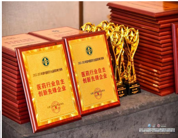
九芝堂上榜“中国医药制造业百强”、“中国医药自主创新先锋企业”、“中国医药行业守法诚信企业”