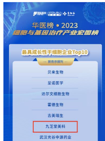
九芝堂美科入选华医榜