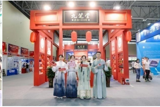
九芝堂参展樟树第 54 届全国药材药品交易会