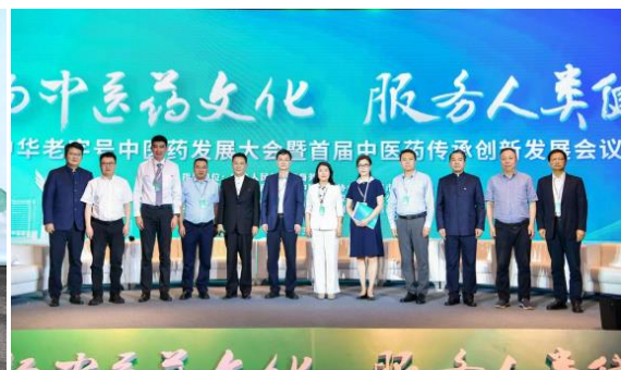
参加中华老字号中医药发展大会暨 首届中医药传承创新发展会议