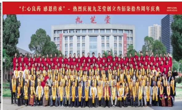
九芝堂创立 373 周年庆典隆重举行