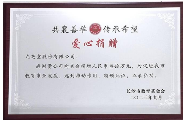
九芝堂获长沙市教育基金会捐赠证书