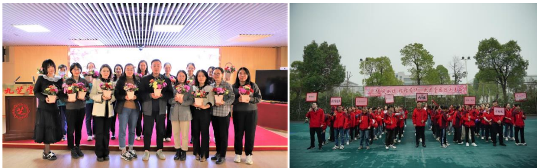
公司开展系列三八妇女节庆祝活动