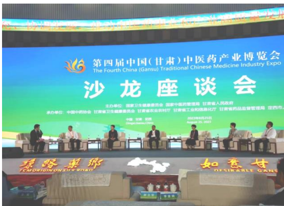
九芝堂参加第四届中国中医药产业博览会

做好文化沉淀与积累，打响“九芝”品牌，讲好“九芝”故事，让世界听到“九芝”声音。