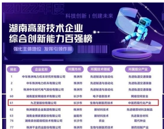
九芝堂成功入选 2022 年