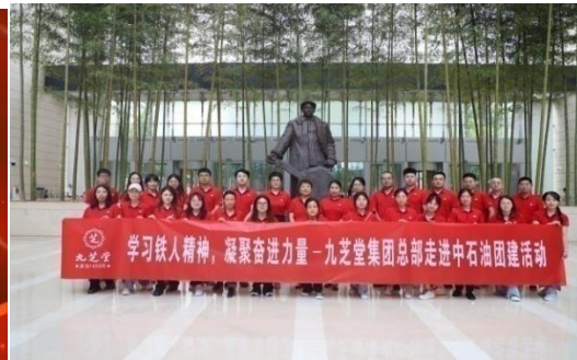
公司开展走进中石油团建活动