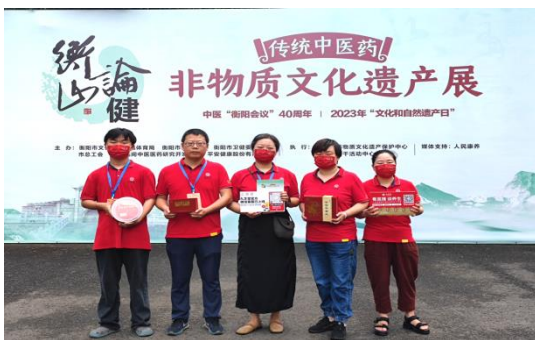
参展“衡山论健” 传统中医药非物质文化遗产展