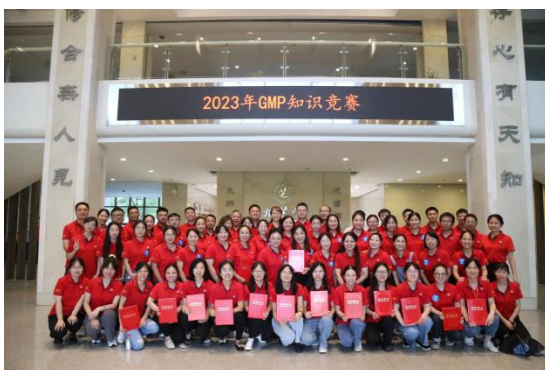
公司开展 GMP 知识竞赛活动