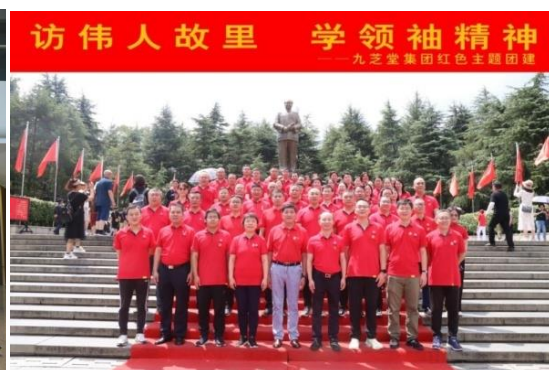
公司开展红色主题团建活动