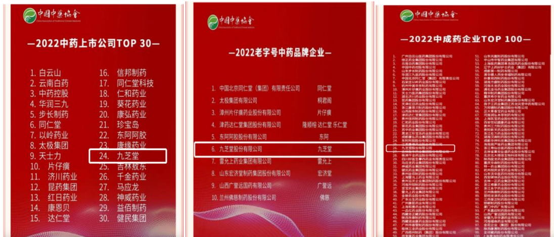
九芝堂荣获“2022 中药上市公司 TOP30”“2022 中成药企业 TOP100”“2022 老字号中药品牌企业”第六名多项荣誉