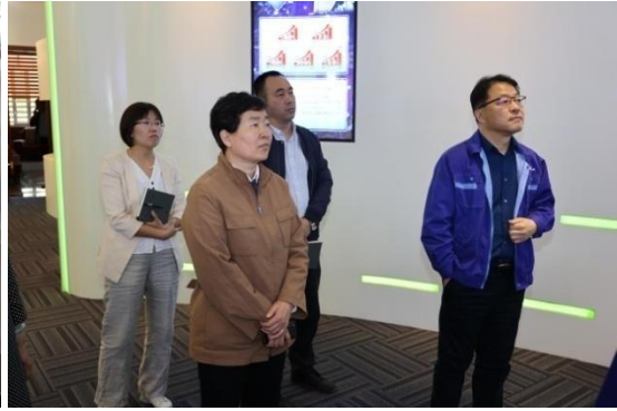
黑龙江省委统战部副部长吴海宝调研走访