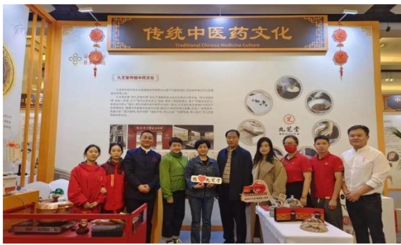
九芝堂传统中药文化参展 中国成都国际非物质文化遗产节