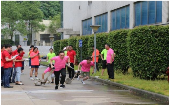
公司开展“安全生产月”活动