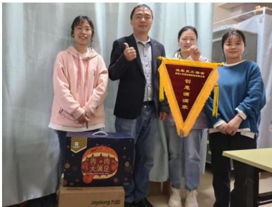
金鼎药业组织开展温馨员工宿舍评选活动