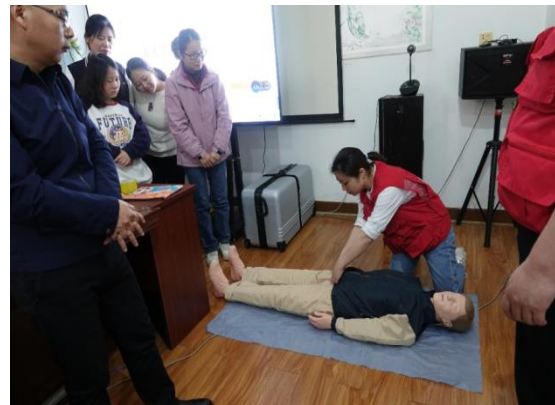
斯奇生物开展 2023 年健康科普集中培训