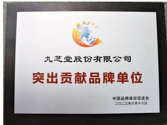
九芝堂荣获“品牌价值领跑者”“突出贡献品牌单位”荣誉称号