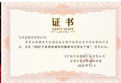
九芝堂荣登“2023 中药创新品牌企业”榜单 九芝堂获评中药企业新媒体传播影响力十强