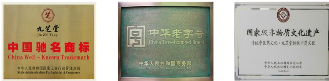
公司“中国驰名商标”“中华老字号”“国家级非物质文化遗产”牌匾

公司拥有“九芝堂”、“友搏”两个“中国驰名商标”。2006 年 9 月，“九芝堂”被国家商务部认定为“中华老字号”，2008 年 6 月，九芝堂传统中药文化被列入国家级非物质文化遗产保护目录。