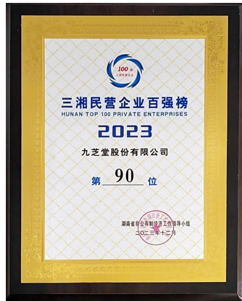
九芝堂上榜 2023 三湘民营企业百强榜