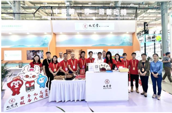
九芝堂精彩亮相 2023 服贸会