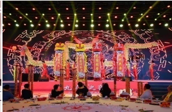
“文化自信 中医先行” 九芝堂主题晚会圆满举行