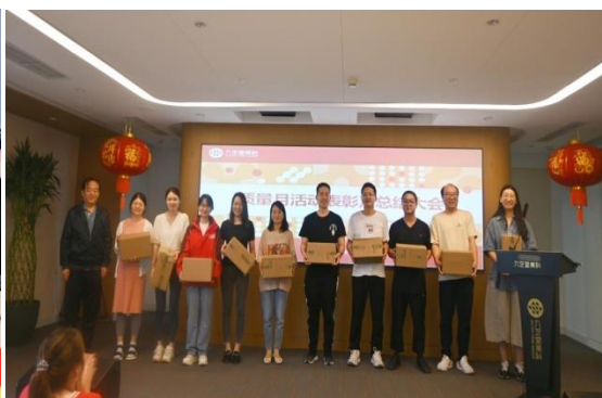
九芝堂美科开展主题“质量月”活动