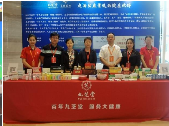
九芝堂亮相第五届中国中药资源大会