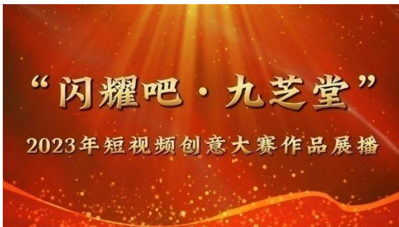
公司开展“闪耀吧 九芝堂”短视频创意大赛