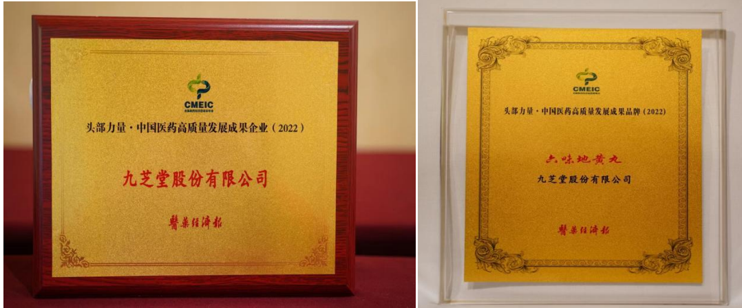
九芝堂荣获头部力量·中国医药高质量发展成果企业及品牌两项大奖