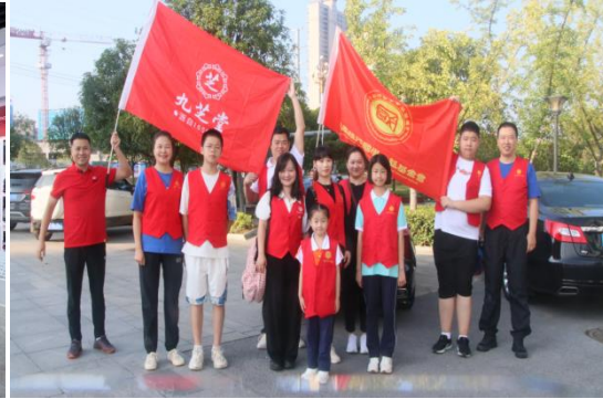
九芝堂参加践行国学公益基金会 第十六次湘西爱心助学