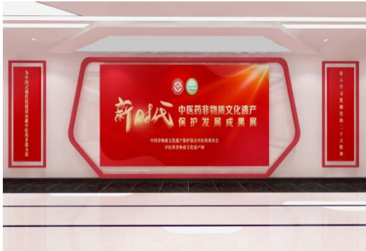
“九芝堂传统中药文化”参展 “新时代中医药非物质文化遗产保护发展成果展”