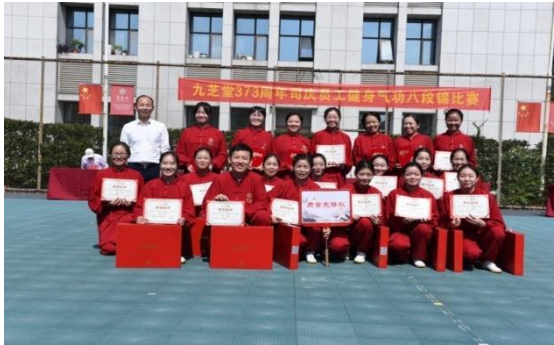
公司开展 373 周年司庆八段锦比赛