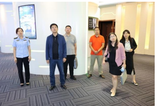
国家知识产权局专利局审查员调研走访