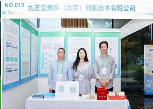
九芝堂美科亮相中国干细胞第十三届年会