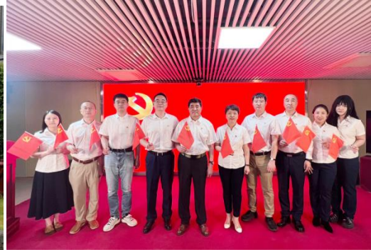
公司开展“我与党旗合个影”主题摄影比赛