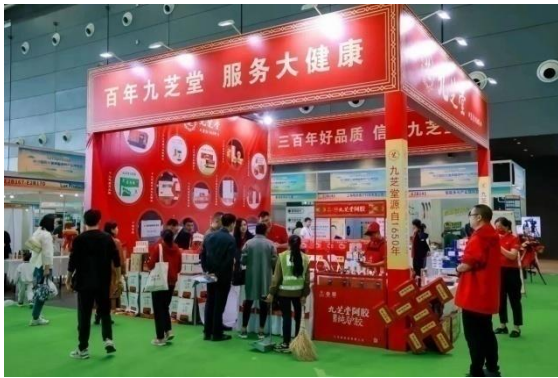
九芝堂亮相 2023 长沙国际大健康 暨康养产业博览会