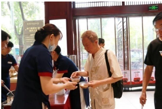
九芝堂开展“健康一‘夏’”活动