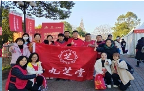
公司参加“红动橘洲”红色半程马拉松赛