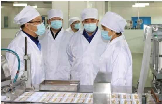
黑龙江省委副书记、省长梁惠玲调研走访