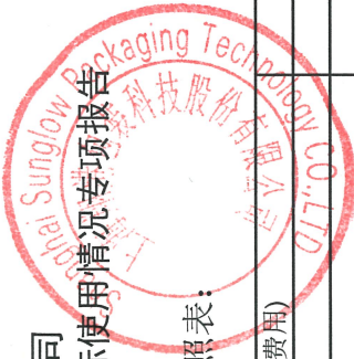
附表 1：募集资金使用情况对照表：