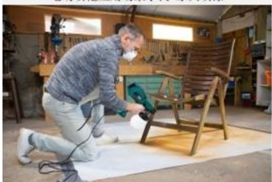
电动喷枪应用场景示例-家具喷漆