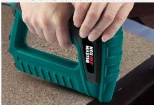
电动钉枪应用场景示例-板材钉合