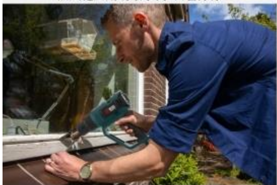
热风枪应用场景示例-门窗除漆