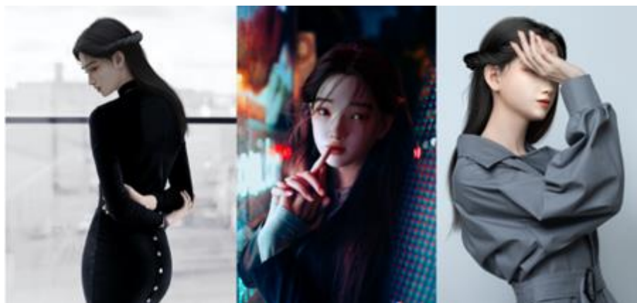
图：公司虚拟数字人“淼淼”