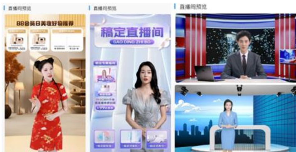
图：“星河”AI 数字人直播平台

“星河”AI 数字人直播平台拥有海量场景库、多元形象库，上传音频或文本即可输出直播或短视频内容，可实现真人的形象及声音复刻、可根据提供的任何语音及文本素材，智能识别并一键产出数智化视频内容，并支持抖音、视频号等主流平台输出。“星河”AI 数字人（2.5D）通过高度智能化的设计，能够灵活地担任多种角色，包括虚拟主持人、虚拟电商主播、虚拟教师、虚拟医生以及社交媒体的数字化身等。“星河”AI 数字人不仅能够与用户进行自然流畅的互动，还能够在 AI 数字人直播、AI 数字人视频生成等领域提供全方位的服务支持，极大地丰富了 AI 数字人的应用场景。