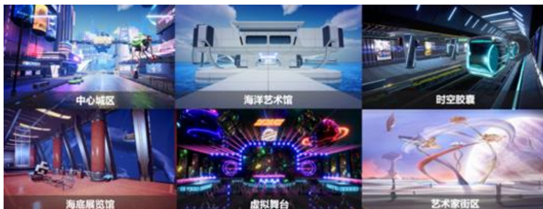
图：“无限盒子”空间场景

元宇宙虚拟数字商业综合体“无限盒子”已开放包含中心城区、海洋艺术馆、海底展览馆、时空胶囊、虚拟舞台等空间场景，配套了品牌概念店、地标建筑以及各种穿梭交通方式，初步搭建了多样化商业类型及多元化数字内容应用场景的商业综合空间。