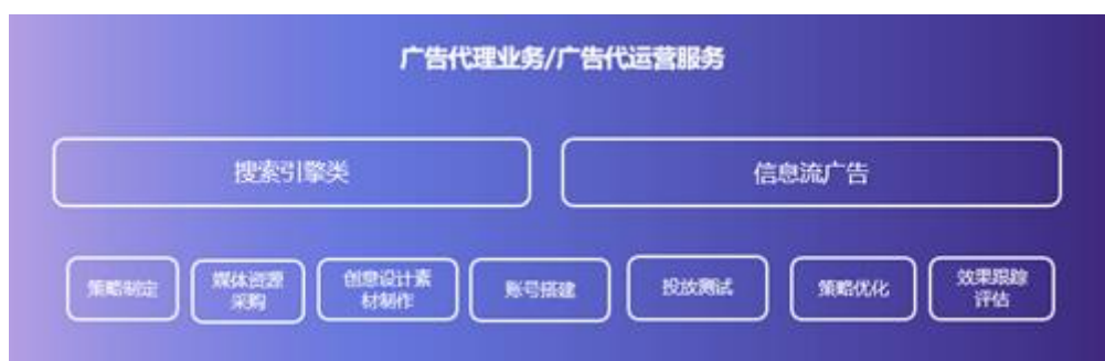
图：数字化营销服务

公司是链接互联网媒体资源与企业客户的桥梁，面对客户的多元化营销需求，公司基于深厚的行业积淀，通过腾讯、360、爱奇艺、今日头条、抖音等互联网媒体平台，为客户提供精准的广告投放及广告代运营服务。其服务模式主要为向客户提供互联网广告从策略制定、媒体资源采购、创意设计和素材制作、投放测试和策略优化以及最终投放效果跟踪评估的整体解决方案。