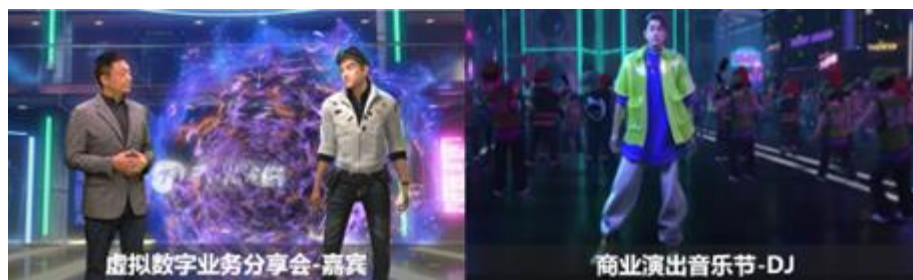
图：公司虚拟数字业务传递官“元启”商业合作场景图

公司自有虚拟数字业务传递官“元启”已在企业内部培训、宣传片拍摄等应用场景落地，并推出全新数字人形象“淼淼”。