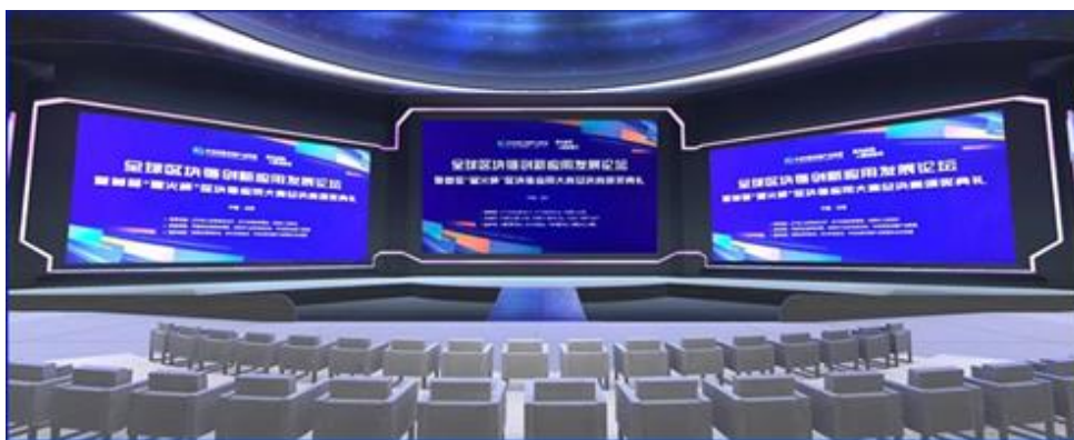
图：ABI 元宇宙区块链应用示范展厅