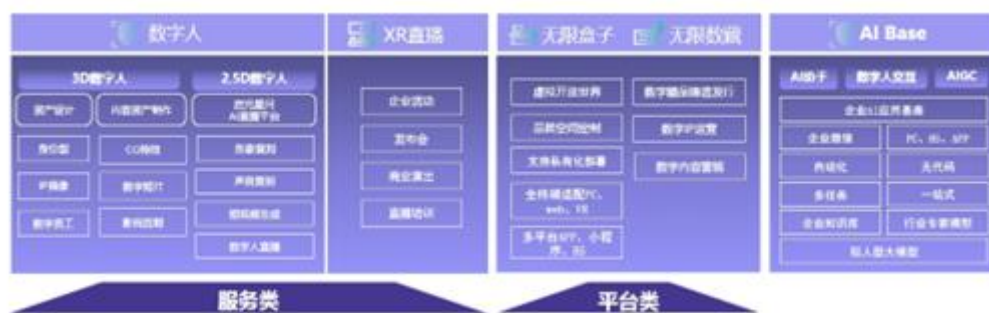
图：虚拟数字业务全景图

②虚拟数字业务：公司依托专业级硬件设施和内容创作团队，帮助企业/品牌在新流量时代创建虚拟数字形象及衍生资产，搭建品牌商业化基建。运营团队将以客户需求为原点，提供创新式适用于多维度应用场景的内容运营及商业化解决方案。目前公司虚拟数字业务主要分为服务类、平台类及 AI 业务三大业务模块，可为客户提供数字人、数字内容、数字场景、XR 直播、数字资产的制作、发行等服务，使品牌及其衍生资产在新流量时代进入消费者视野并最终沉淀到品牌流量池。