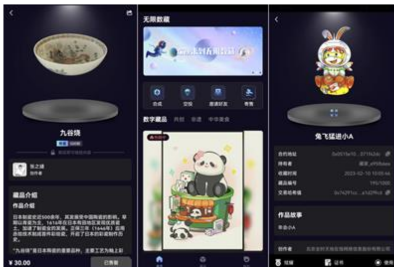
图：数字藏品发行平台“无限数藏”

数字藏品发行平台“无限数藏”是基于区块链底层技术建设的涵盖数字藏品铸造、登记发行、营销推广、交易、存证备案等功能的一体化综合性服务平台。