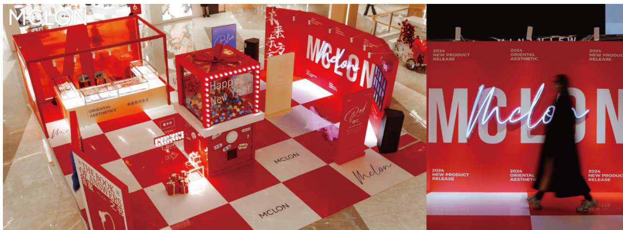
公司品牌渠道巡展

公司深耕线下业务，持续优化渠道结构，加快布局省外加盟门店。公司开店策略是在核心城市的核心商圈开设直营店，其他地方拓展加盟。目前公司已布局 9 省 2 市，公司拓展省外加盟市场，建立以省级加盟代理为枝干，市级加盟代理为补充的全国加盟开发网络，聚焦省外门店增长，通过产品结构的优化、运营精细化管理和门店优化，浙江省外门店收入大幅增长，利润增长。2023 年新开拓市场主要集中在公司优势区域，将网点布局“做深、做透、做强”，形成“护城河”。同时在部分市场进行终端渠道优化升级，增设区域标杆项目。积极吸收行业内优秀客户，以加盟为主拓深网点“密度”；更加强化成熟市场占有率。