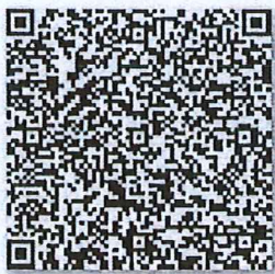
于颖的年检二维码

同意调出 Agree the holder to be transferred from