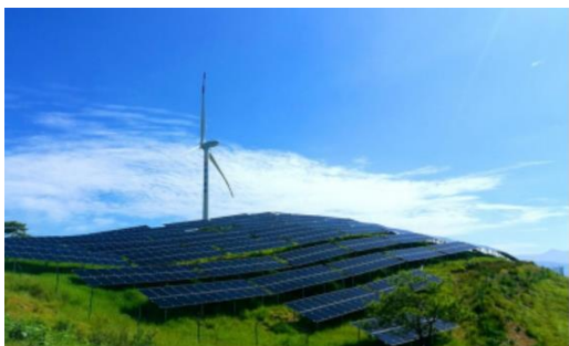
盐边大面山农风光发电互补项目

报告期内，依托控股股东四川能投集团资源优势，积极争取四川省“多能互补”新能源指标，与控股股东所属公司共同组建合资平台，在理塘、马尔康、会东、美姑四地共获取 180 万千瓦新能源指标，正在有序开展项目核准、备案等工作。