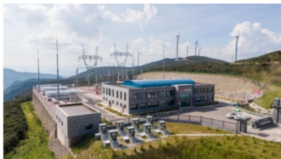
美姑井叶特西升压