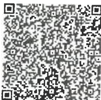
刘远帅年检二维码

本证书经检验合格, 继续有效一年。 This certificate is valid for another year after this renewal.