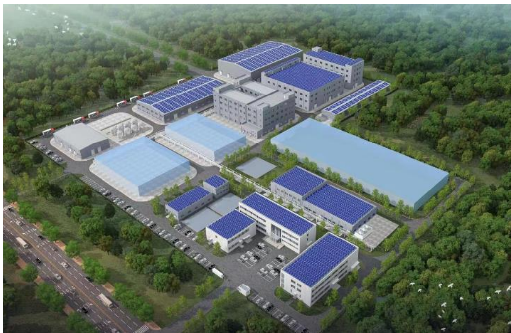
公司喷印产业一体化基地项目鸟瞰图（天津）

随着公司数码喷印设备市场保有量的提升，以墨水为代表的耗材配件销售规模也将持续增加。公司注重产业链的延伸与布局，喷印产业一体化基地项目近日已在天津经开区南港工业区正式开工。该项目投资约 6 亿元，占地面积达 9.3 万平方米，建设年产 4.7 万吨数码喷印墨水和 200 台工业数码喷印机的喷印产业一体化生产线等。该项目计划将于 2025 年建成投产，将打通宏华数科数码喷印全产业链，促进企业提效降本、提升竞争力。