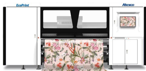
图 2：EcoPrint 涂料数码印花机