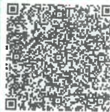
冯高的年检二维码

本证书经检验合格，继续有效一年。 This certificate is valid for another year after this renewal.