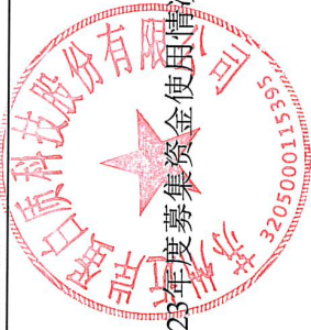
附表1：2023年度募集资金使用情况对照表