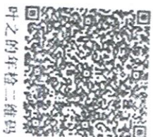
叶之的年检二维码

本证书经检验合格, 继续有效一年。 This certificate is valid for another year after this renewal.