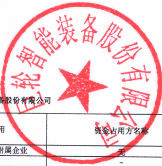
2023年度非经营性资金占用及其他关联资金往来情况汇总表